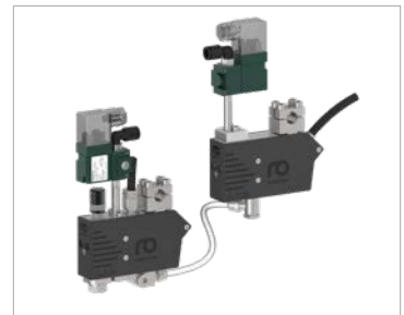
Externer Lufterhitzer abgesetzt montiert