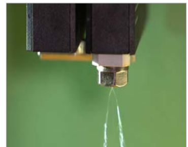
Optimales Zusammenspiel von Sprühluft und Klebstoff