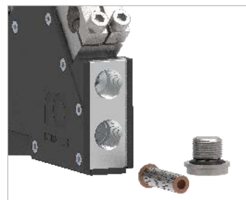
Filtro de adhesivo integrado