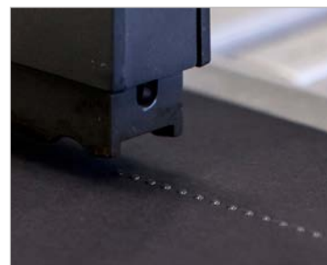
800 puntos por segundo