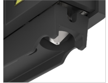
Dış etkilere karşı nozul koruması