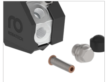
Entegre filtre nozul tıkanıklıklarını önler