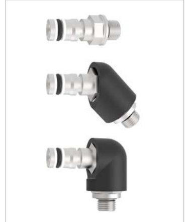
0°, 45°, 90° vida bağlantıları