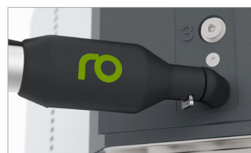
Connettore a spina PrimeConnect