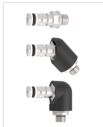
Connettori a spina 0°, 45°, 90°