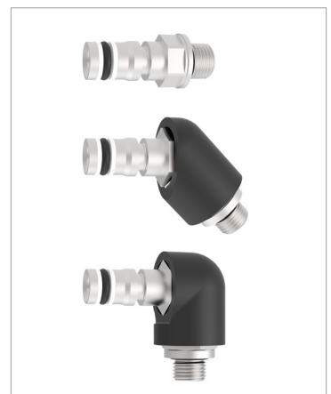
Steckverschraubungen 0°, 45°, 90°