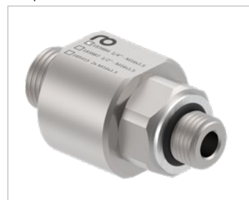
Złącze obrotowe osiowe niskotemperaturowe