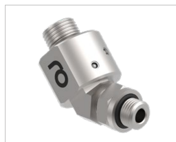
Złącze obrotowe kątowe 45° niskotemperaturowe