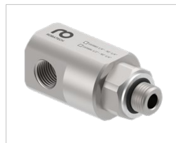
Raccord rotatif non chauffé à 90°