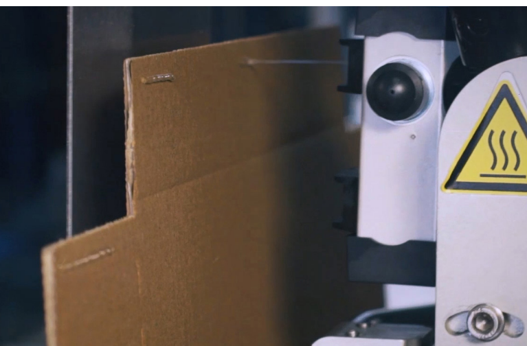
Intermittierender Raupenauftrag auf Deckellasche mit SX LongLife

Vervo Advanced Packaging Technologies mit Sitz in Istanbul, Türkei, konzentriert sich seit 2010 auf die Automatisierung von Endverpackungslinien und die Herstellung von Wrap-Around-Verpackungsmaschinen für Sekundärverpackungen aus Karton.