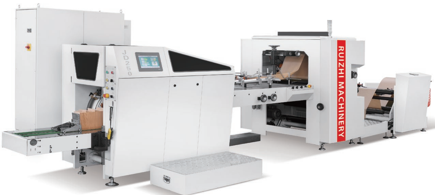
Máquina para fabricar bolsas de papel con ventanilla