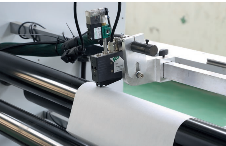
Primera aplicación de cordones continuos con AX Diamond

Ruizhi Packing Machinery Co., Ltd., con sede en Wenzhou, (China) exporta el 70 % de sus máquinas en todo el mundo. Desde 2003, la empresa se centra en la fabricación de máquinas para fabricar bolsas de papel y apuesta por un encolado de calidad.