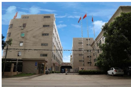
Stabilimento Dayuan di Zhongshan, Guangdong

Dayuan ha immesso sul mercato le sue coppette di carta, prodotte con la macchina dell'azienda stessa e certificate dall'Autorità nazionale in materia di igiene. Queste coppette di carta sono state utilizzate durante la Shanghai World Expo del 2010 all'Aeroporto internazionale Pudong di Shanghai e all'Aeroporto Hongqiao, ma anche in altri principali aeroporti e strutture pubbliche nazionali, tanto da divenire molto popolari sul mercato.