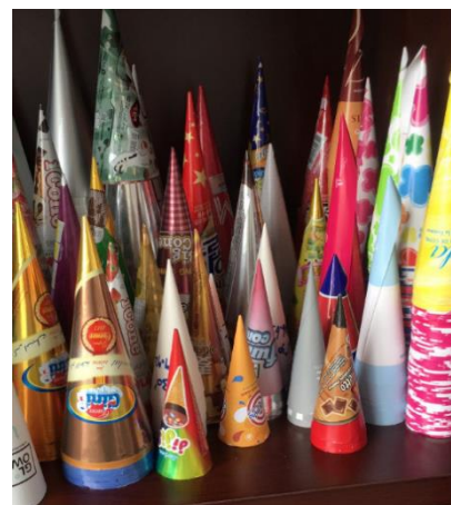
Coni di carta per gelato

questi requisiti, gli specialisti Robatech hanno elaborato la soluzione ideale per il processo: una configurazione che prevede il fusore con serbatoio da 5 kg della serie Concept e la comprovata pistola applicatrice AX Diamond. È stato subito chiaro che questa pistola applicatrice era la scelta giusta. Il filtro, integrato nel blocco riscaldante della pistola, previene l'otturazione degli ugelli e il sistema di protezione riduce al minimo i danni agli ugelli e la dispersione di calore. Tutte queste caratteristiche contribuiscono all'ottenimento di un taglio preciso e un minor numero di interruzioni. Soprattutto l'isolamento CoolTouch della pistola applicatrice, permette di aumentare la sicurezza sul lavoro e di utilizzare l'energia in modo efficiente: assicura una temperatura di fusione costante e impedisce impatti indesiderati di flussi d'aria.