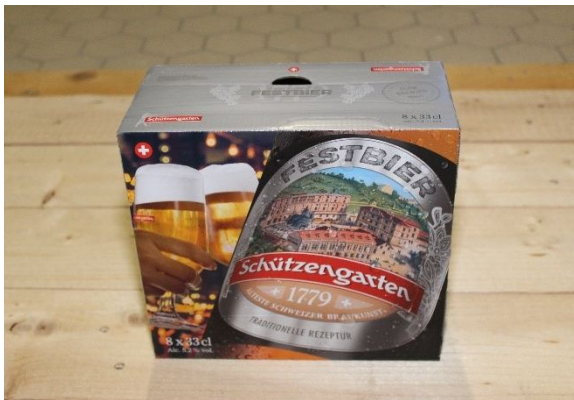
准备运送的纸板箱

Schützengarten 的包装系统可实现约每小时 27,000 瓶的生产量。如果采用手动加胶，这意味着操作人员必须每 20 分钟将颗粒胶重新加入两个熔缸中。虽然熔缸配备了液位传感器并会对空转进行警告，但工作人员必须持续监控并准备好重新加胶。