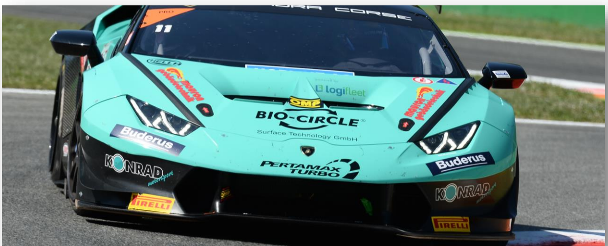
Illustration: Voiture de course de Lucas Mauron, écurie Lamborghini Super Trofeo