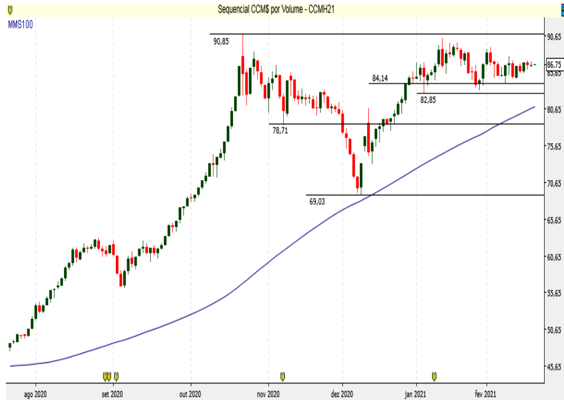
CCM$ - Diário - criado em 22/02/2021

O Milho BM&F tem suportes em 84,00 e 82,80.