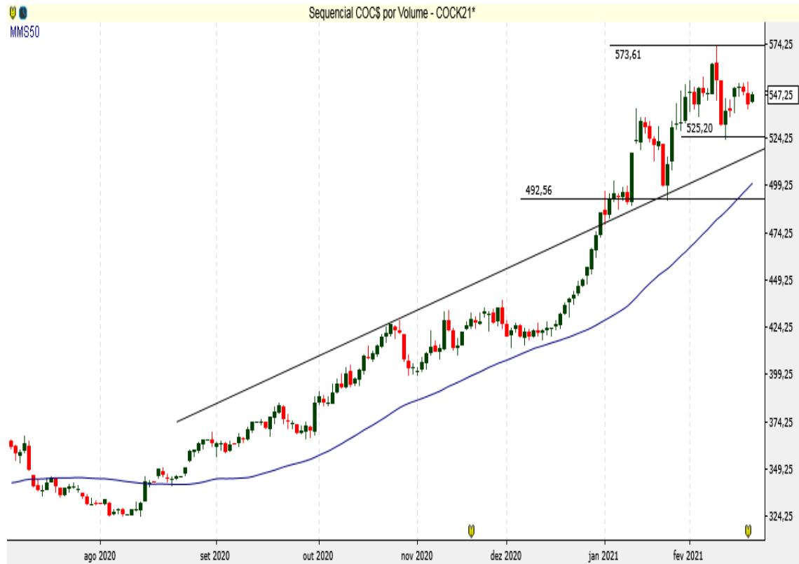
COC$ - Diário - criado em 22/02/2021

O Milho Chicago mantém suportes 525/500,00.