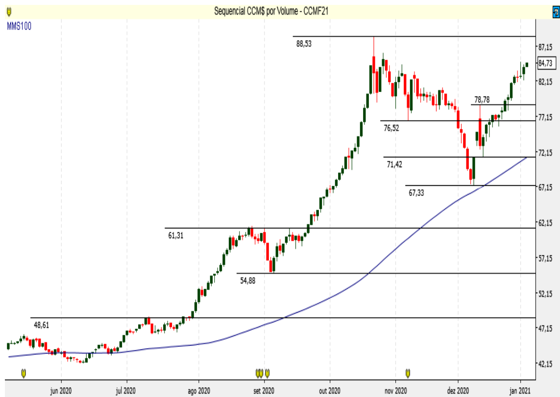
CCM$ - Diário - criado em 06/01/2021

O Milho BM&F retoma a pressão compradora.