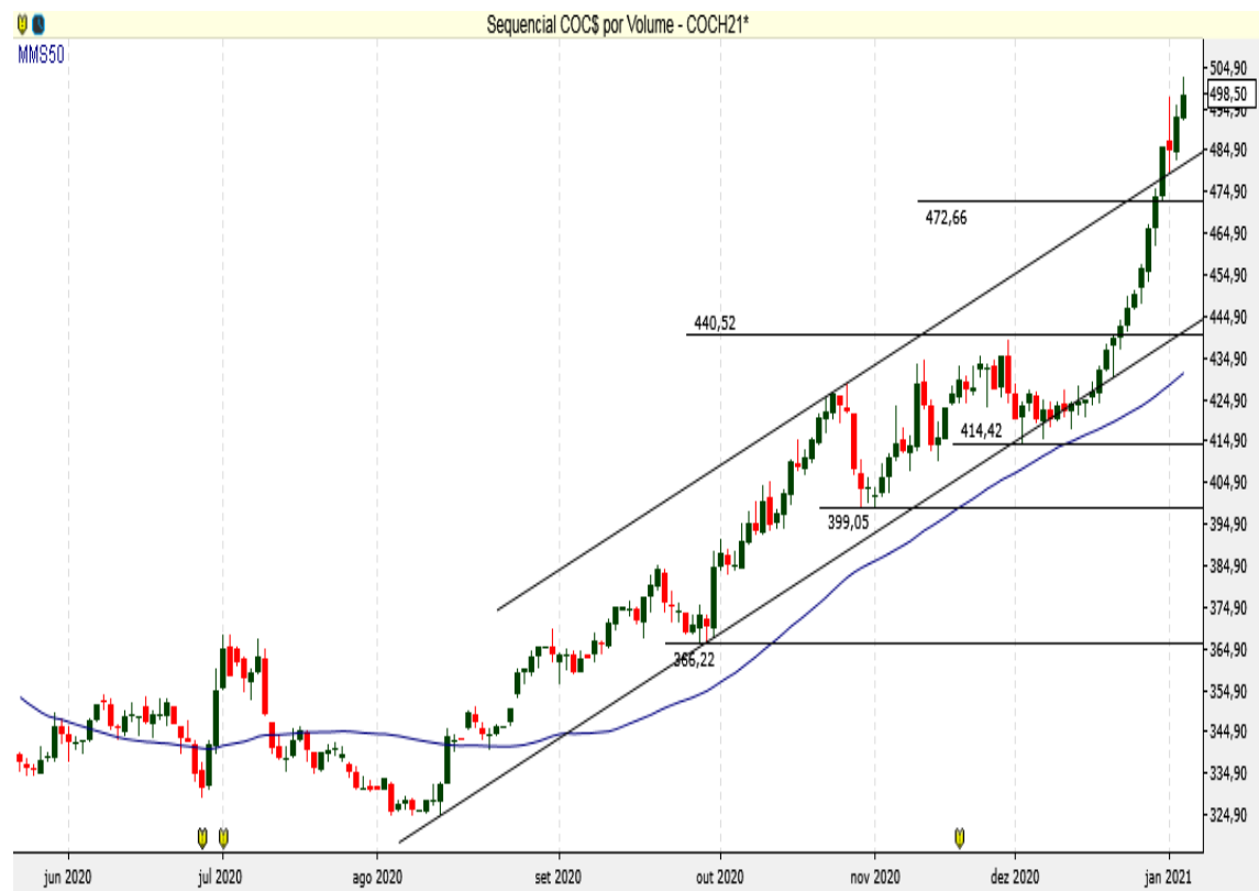
COC$ - Diário - criado em 06/01/2021

O Milho Chicago supera resistência e mostra pressão na compra.