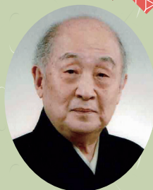
四世 山本東次郎則壽