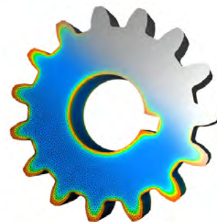
Traitement thermique en surface (cémentation, trempe, revenu)