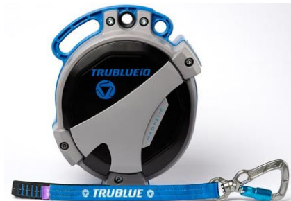
Model TBiQ-XL (20m lanyard, various connectors)