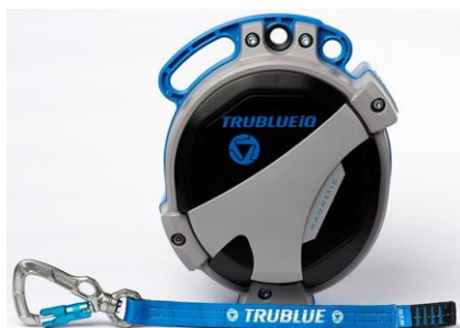
Model TBiQ-LT (12.5m lanyard, various connectors)