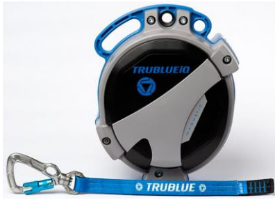
Model TBiQ-LT (12.5m lanyard, various connectors)