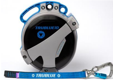
Model TBiQ-XL (20m lanyard, various connectors)