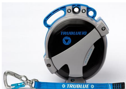
Model TBIQ-LT (12.5m lanyard, various connectors)