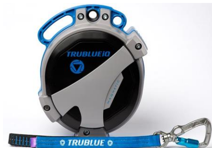
Model TBIQ-XL (20m lanyard, various connectors)