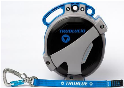
Model TBiQ-LT (12.5m lanyard, various connectors)