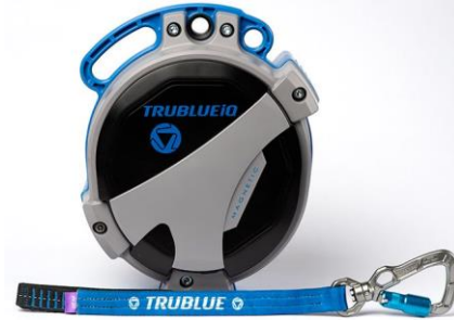
Model TBiQ-XL (20m lanyard, various connectors)