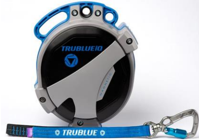
Model TBIQ-XL (20m lanyard, various connectors)