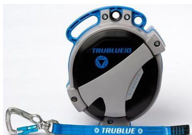
Model TBIQ-LT (12.5m lanyard, various connectors)