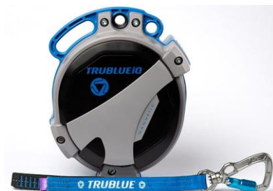
Model TBIQ-XL (20m lanyard, various connectors)