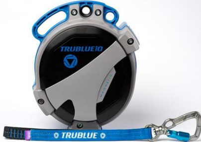
Model TBIQ-XL (20m lanyard, various connectors)