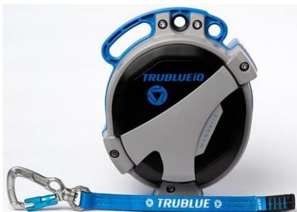
Model TBIQ-LT (12.5m lanyard, various connectors)