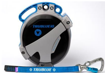
Model TBiQ-XL (20m lanyard, various connectors)