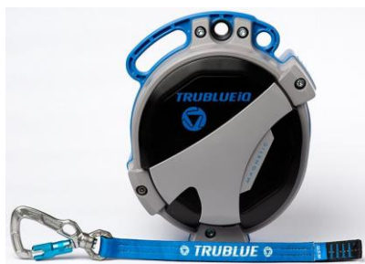
Model TBiQ-LT (12.5m lanyard, various connectors)