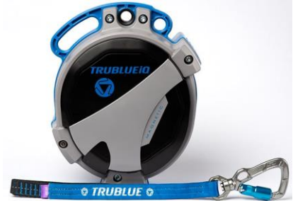
Model TBIQ-XL (20m lanyard, various connectors)