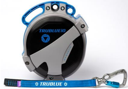
Model TBIQ-XL (20m lanyard, various connectors)