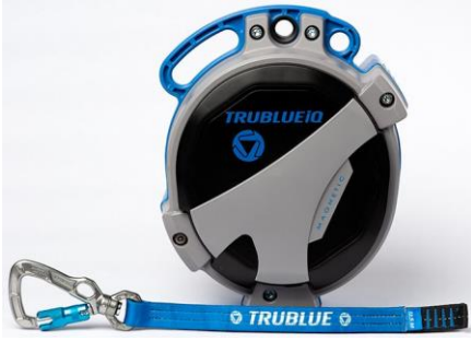
Model TBiQ-LT (12.5m lanyard, various connectors)