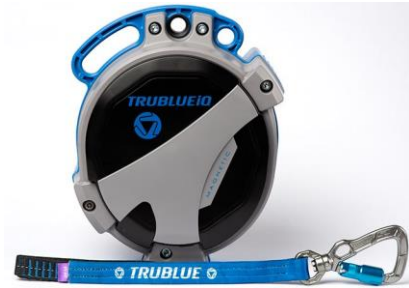
Model TBIQ-XL (20m lanyard, various connectors)