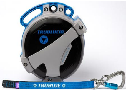
Model TBIQ-XL (20m lanyard, various connectors)