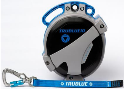
Model TBiQ-LT (12.5m lanyard, various connectors)