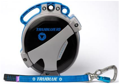
Model TBiQ-XL (20m lanyard, various connectors)