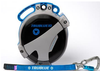
Model TBiQ-XL (20m lanyard, various connectors)