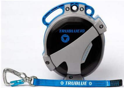
Model TBiQ-LT (12.5m lanyard, various connectors)