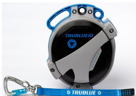
Model TBiQ-LT (12.5m lanyard, various connectors)