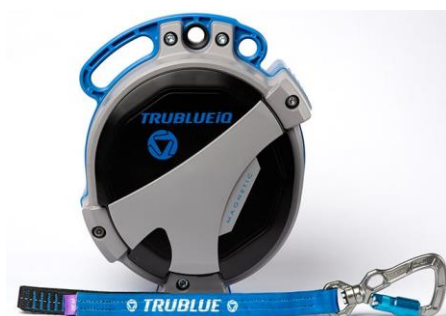
Model TBiQ-XL (20m lanyard, various connectors)