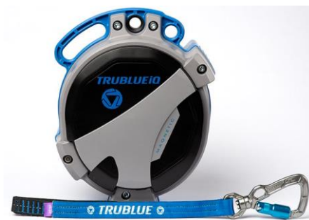
Model TBIQ-XL (20m lanyard, various connectors)