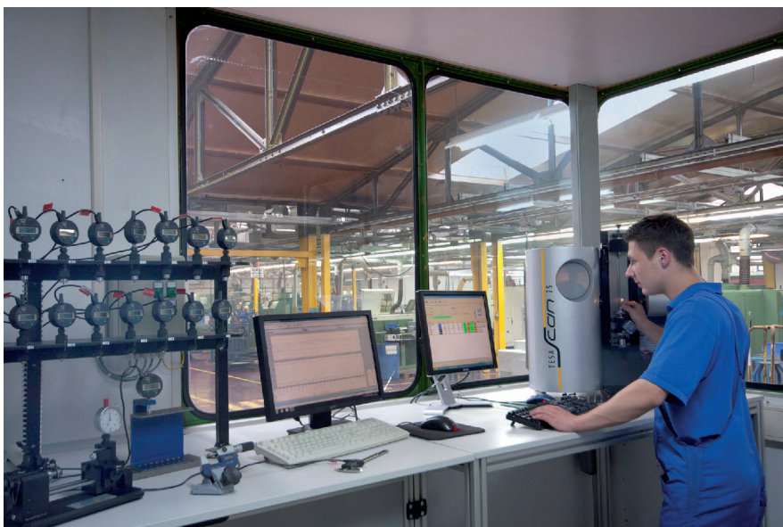
Bild 3. Der anspruchsvolle Betrieb aus Nordrhein-Westfalen verfügt über eine geschlossene Produktionskette mit hoher Fertigungstiefe und elektronisch überwachter Prozesssicherheit.