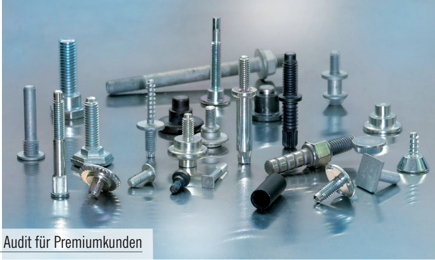
Bild 1. Das Unternehmen Wilhelm Schumacher ist ein kompetenter Hersteller qualitativ besonders hochwertiger Verbindungselemente, Schrauben, Kaltform- und Stahl-Kunststoffverbundteile.

Gezielte Prüfintervallüberwachung beeindruckt beim Audit für Premiumkunden