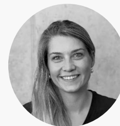
SERAINA Food & Beverage