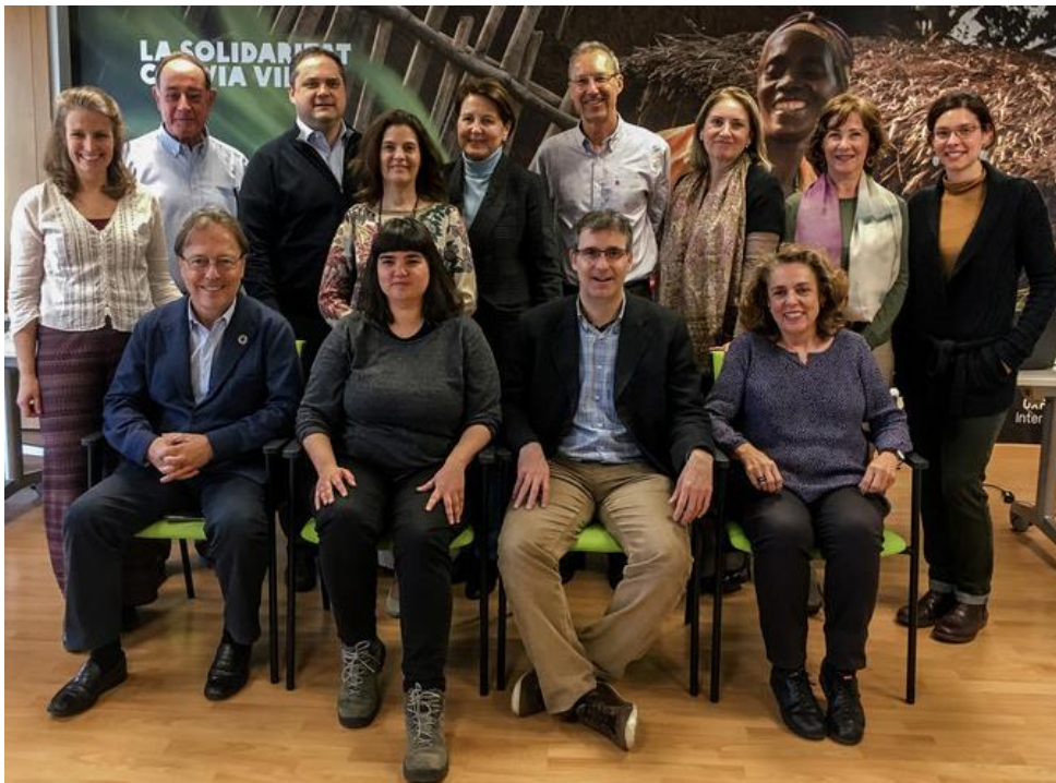
Patronato Oxfam Intermón

Siento orgullo de la gente con la que trabajamos en tantos países del mundo. Especialmente de las mujeres que luchan por los derechos de la población, se rebelan contra la pobreza y la injusticia y con el apoyo de organizaciones como Oxfam Intermón consiguen cambiar la situación y construir un futuro mejor para sus familias y comunidades.