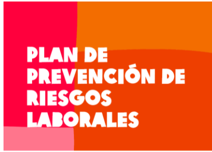
MANUAL DE SISTEMAS DE GESTIÓN PARA LA PREVENCIÓN DE RIESGOS LABORALES

3.1.7. La organización posee varios canales de comunicación interna con información constante y actualizada.