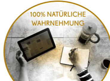
100% NATÜRLICHE WAHRNEHMUNG MINIMIERTE VERZERRUNGEN