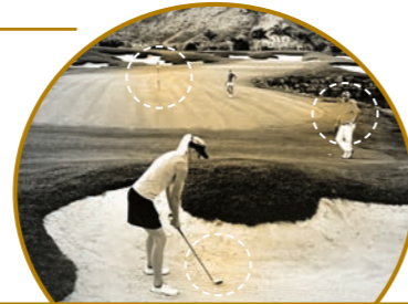
EXTREME SCHÄRFE BEI JEDER ENTFERNUNG

Ergebnisse präziser Ingenieursarbeit Intelligent Magnification Control von Seiko ist nur eine der Technologien, die SEIKO Brilliance so einzigartig machen. Das Flächendesign sorgt für eine realistische Bilddarstellung bis zu den Glasrändern und minimiert selbst kleinste Verzerrungen. Darüber hinaus reduziert es das Schwindelgefühl und sorgt für ein breiteres Sichtfeld bei gleichzeitiger Verbesserung der Nahsicht. Dimensionen können naturgetreu dargestellt werden und Objekte, die aus nächster Nähe betrachtet werden, behalten ihre authentischen Formen bei.