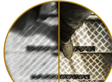
REDUZIERUNG VON SCHWINDEL*