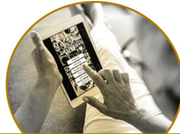
HÖCHSTER KOMFORT BEI DER NUTZUNG DIGITALER GERÄTE

Der Digital Zoom Equalizer ist ein untrennbarer Bestandteil von SEIKO Brilliance, da er dem Brillenträger ein Gefühl der Bequemlichkeit bei der gleichzeitigen Nutzung mehrerer digitaler Geräte verleiht. Der Progressionsbereich ist optimiert, um mühelos zwischen Entfernungen zu wechseln und entspannte und aktive Augen zu bewahren. Auch im Nahbereich werden die individuellen Sehstärken des Brillenträgers berücksichtigt, um die Sehleistung zu steigern. Der Digital Zoom Equalizer schafft dadurch ein breiteres Sichtfeld in der Nähe als vorherige Seiko Gleitsichtgläser.