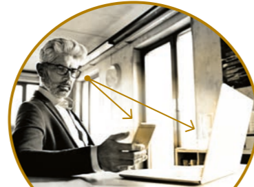
MÜHELOSER WECHSEL DES FOKUS