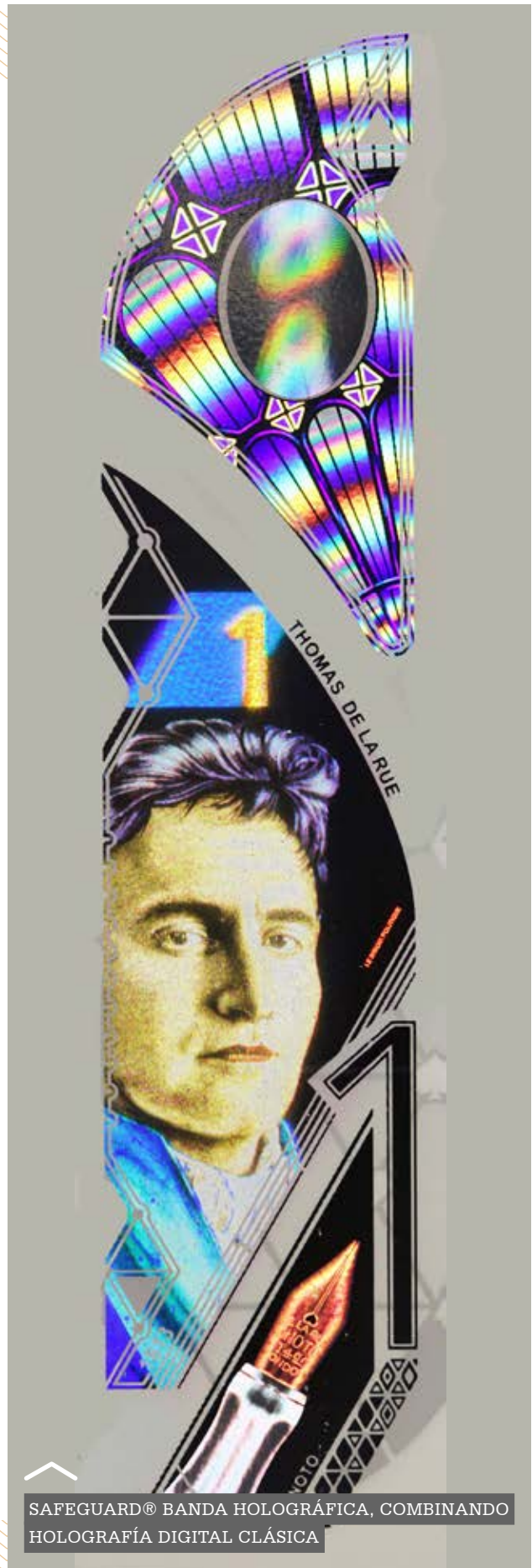
SAFEGUARD® BANDA HOLOGRÁFICA, COMBINANDO HOLOGRAFÍA DIGITAL CLÁSICA

Cuando el valor del billete es bajo o donde la moneda no es un objetivo importante para los criminales, una ventana de polímero seguro o un simple cambio de color en un hilo es más que suficiente para asegurar el billete. Sin embargo, los costos y el impacto ambiental se han convertido en una preocupación emergente en los últimos años. SAFEGUARD® ha ayudado en este aspecto, con billetes que duran 2,5 veces más que el papel de promedio y se reciclan fácilmente.