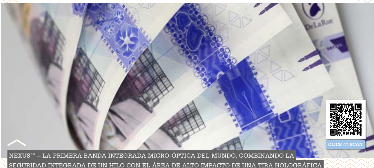
NEXUS™ – LA PRIMERA BANDA INTEGRADA MICRO-ÓPTICA DEL MUNDO, COMBINANDO LA SEGURIDAD INTEGRADA DE UN HILO CON EL ÁREA DE ALTO IMPACTO DE UNA TIRA HOLOGRÁFICA

gratificante, aunque a veces sea un trabajo duro. En paralelo, las tecnologías habrán avanzado desde que se lanzó la última serie y el entorno macroeconómico también puede cambiar drásticamente durante ese período de tiempo (por ejemplo, el tema de sostenibilidad está ahora mucho más presente en la agenda que hace diez años). Los expertos galardonados de De La Rue apoyan asiduamente a los Bancos Centrales y a las imprentas estatales en todas las etapas del ciclo de vida de los billetes, desde los diseños conceptuales y modelado de escenarios hasta la destrucción/reciclaje de billetes al final de su vida útil. Diseñan y fabrican sustratos de polímeros, características de seguridad y billetes para más de la mitad de todas las autoridades emisoras de divisas en el mundo. Ayudan a incorporar características de seguridad de De La Rue y sustrato de polímero SAFEGUARD® en billetes impresos por muchas impresoras comerciales y fábricas de impresión estatales; y han diseñado un tercio de todos los billetes actualmente en circulación. Si bien el nuevo proyecto de la serie de billetes ocurre sólo ocasionalmente dentro de un departamento emisor, De La Rue está apoyando continuamente este tipo de proyectos.