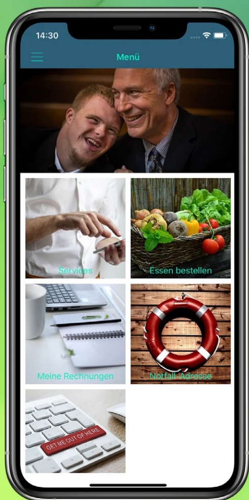
In der Menü-Übersicht kann mittels großer Kachelnavigation direkt in die gewünschten Bereiche abgesprungen werden.

Neben den individuellen Funktionen kann auch das Design der App ganz nach Ihren Vorgaben angepasst werden - mit Ihrem Logo, Ihren Farben und Symbolen. Jeder kann sehen, dass die App zu Ihrer Einrichtung gehört. Sie können die App auch zur Steigerung Ihrer Bekanntheit und Attraktivität nutzen und allgemeine Inhalte über Ihre Einrichtung und Dienste bereitstellen.