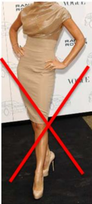
ZU HOHE ABSÄTZE UND PLATEAU-SCHUHE