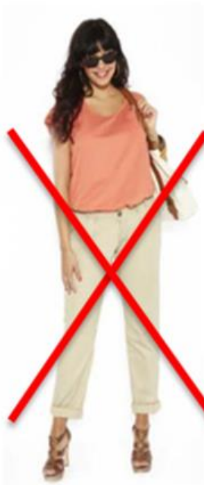
CHINO-HOSE OHNE FALTENBILDUNG OFFENE SCHUHE SONNENBRILLE IM INNENBEREICH