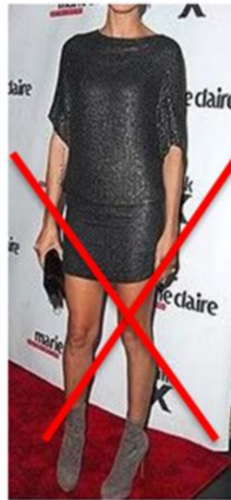
ROCK ZU KURZ STIEFEL MIT ROCK