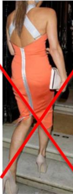
NACKTE SCHULTERN UND ZU HOHE ABSÄTZE