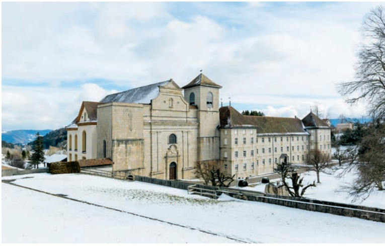
Un nouvel ascenseur se cache dans la tour nord tronquée de l'abbatiale de Bellelay.