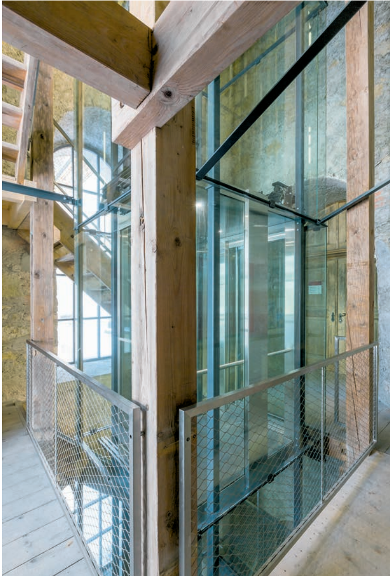
L'architecte a voulu insérer l'ascenseur dans la cage de l'escalier en bois avec la plus grande transparence possible.