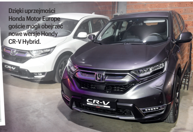
Dzięki uprzejmości Honda Motor Europe goście mogli obejrzeć nowe wersje Hondy CR-V Hybrid.