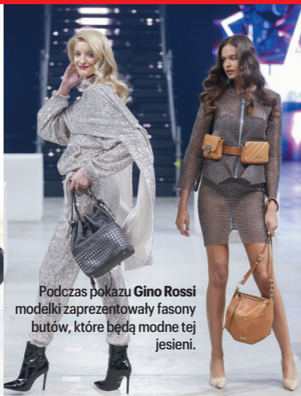
Podczas pokazu Gino Rossi modelki zaprezentowały fasony butów, które będą modne tej jesieni.