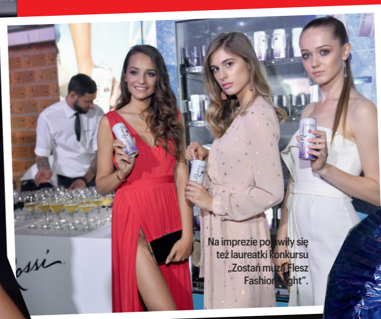
Na imprezie pojawiły się też laureatki konkursu „Zostań muzą Flesz Fashion Night”.