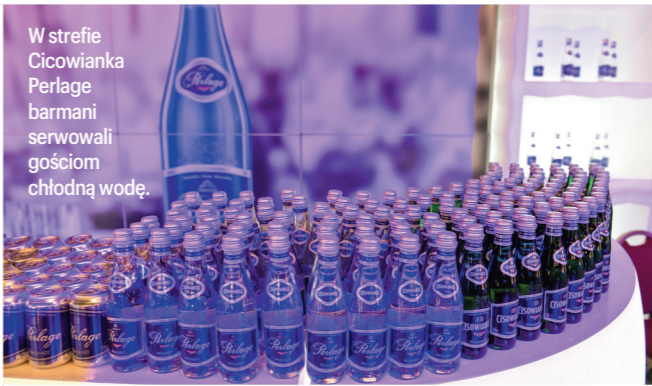
W strefie Ciciowianka Perlage barmani serwowali gościom chłodną wodę.