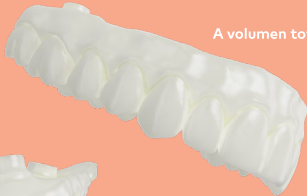
A volumen total