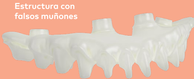
Estructura con falsos muñones